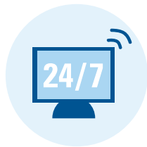
Compliance Web Channel

Hinter dem Hinweisgebersystem steht die Abteilung Corporate Compliance. Mitarbeiter unserer Geschäftspartner können Hinweise über zwei unterschiedliche Kanäle abgeben und besprechen: